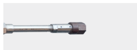
Сопло плоского сечения (15 °)

Высоконапорный пистолет-распылитель SP 3000 E с электрическим разъемом Hammelmann высоконапорные пистолеты-распылители предназначены для требовательного промышленного использования. Эргономичная ручка и различные удлинители просты в установке.