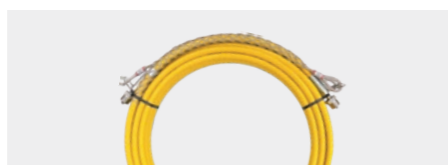
Шланг высокого давления (20 м)