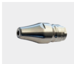
RD Mono (до 2000 бар)

Водный инструмент для профи. Благодаря компактному и легкому дизайну возможна длительная, без усталости работа. Masterjet обеспечивает длительный срок службы благодаря использованию запатентованной системы