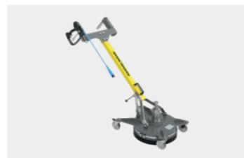
Aquablast Basic E

самый маленький из наших аппаратов очистки резервуаров AQUAMAT впечатляет своей запатентованной технологией HPS, которая также используется в наших роторных форсунках Masterjet.