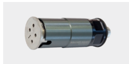
RD Masterjet (до 3200 бар)

Водный инструмент для профи. Благодаря компактному и легкому дизайну возможна длительная, без усталости работа. Masterjet обеспечивает длительный срок службы благодаря использованию запатентованной системы