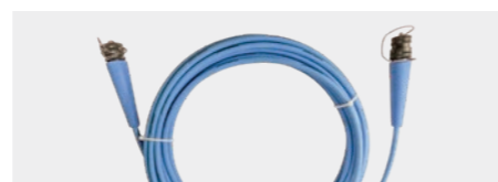
Кабель управления (25 м)